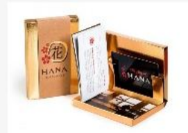
پکیج شماره ۴ ۴۵۰,۰۰۰ تومان