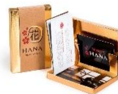
پکیج شماره ۱ (کارت هدیه پایه) ۱۷۰,۰۰۰ تومان