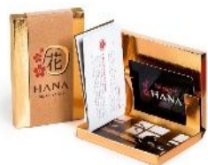
پکیج شماره ۳ ۳۵۰,۰۰۰ تومان