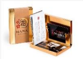
پکیج شماره ۲ ۲۵۰,۰۰۰ تومان