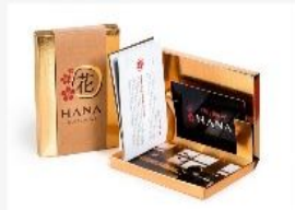
پکیج شماره ۳ ۳۵۰,۰۰۰ تومان