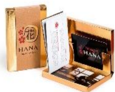
پکیج شماره ۶ ۸۵۰,۰۰۰ تومان

مرحله ۳: انتخاب پکیج مورد نظر از بین محصولات