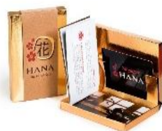
پکیج شماره ۵ ۶۵۰,۰۰۰ تومان