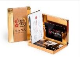
پکیج شماره ۵ ۶۵۰,۰۰۰ تومان