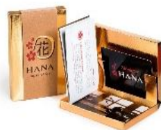
پکیج شماره ۲ ۲۵۰,۰۰۰ تومان